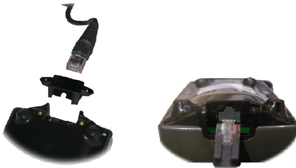
Рис. 2 Разъем терминала iSC250

Пин-пады iPP220/280 оборудованы USB проводом для подключения к терминалу. Гнездо для подключения расположено в задней части пин-пада и защищено крышкой.