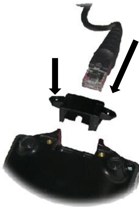
Рис. 3 Подключение кабеля к пин-паду

Подсоедините кабель к пинпаду, закройте коннектор крышкой: