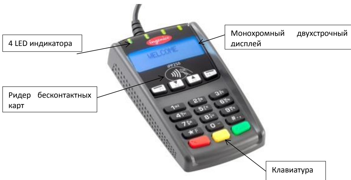
Рис. 1 Пин-пад iPP 250